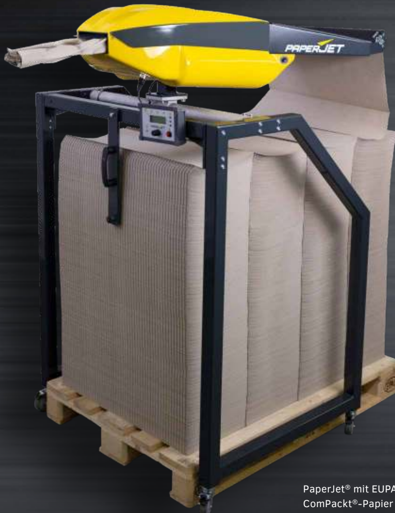
PaperJet® mit EUPAL-Gestell und ComPackt®-Papier (endlos)